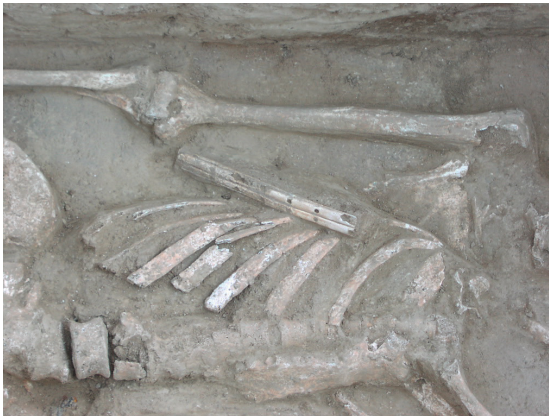
Прилог 7) Налаз двојне свирале некропола Bonyhádról, Мађарска //wmmm.hu/2013-januar/