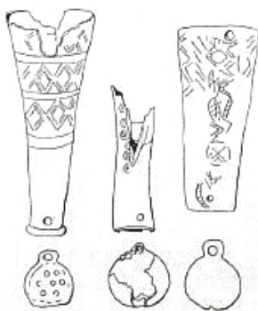
Прилог 2 ) Шамански реквизити и удараљке од костију са прапорцима

Прапорце су користили и аварски шамани. Као шамански реквизити се налазе у гробовима и удараљке од костију са прапорцима. Удараљке су биле шупље, споља лепо резбарене. На дну, где су биле уже, имале су рупицу за коју је причвршћиван прапорац или прапорци. Прапорци су били округлог облика и на врху су имали додатак у облику малог правоугаоника, са рупицом у средини. Може се претпоставити да су кроз ове две рупице биле спајане удараљке са прапорцима (Ковачевић 1977: 197–198, слика 138, Прилог 2 ).