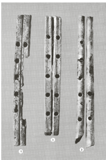
Прилог 3) Словенске двојне свирале са некропола Alattyán и Jánoshida у Мађарској (Kovrig Ilona: Das awarenzeitliche Gräberfeld von Alattyán. Budapest, 1963, LXXVI. tábla nyomán)

Археолошки налаз из некрополе Alattyán на простору данашње Мађарске – словенска двојна свирала “дипле” израђена од кости (VI–VII век) (Kovrig 1963: Тб. 26, (Прилог 3) 27) са пет рупица), слична је онима код трогласних гајди, за које се претпоставља да су Срби утицали на њихов настанак (Лајић-Михајловић 2003: 25). 13 Сличне свирале пронађене су на локалитетима у Хрватској (једнострука свирала VII век, ДЕМО 2008: 131, kat. 6.1) и код Укосе, византијске утврде код Сталаћа (Прилог 4). С обзиром на констатовани словенски слој, ова дипла, којој недостаје пар (VI–VII век), израђена од кости, сматра се словенском свиралом. На истом локалитету нађена је керамичка фрула из истог периода, којој недостаје доњи део са рупицама, вероватно првобитно израђен од органског материјала који се није очувао (Рашковић 2011: 7–8; Ђуровић 2016: 134).