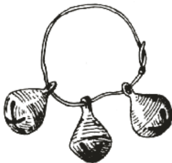
Прилог 1 ) Привесна карика с прапорцима из мошле у Чаркасову код Орше (Нидерле)

Прапорци који висе као привесци на оглицама (Нидерле 1956: 204, слика 28, 36) ( Прилог 1 ) имају купаст (украшен мотивом крљушти, локалитет Фекетић, Dimitrijević i dr. 1962: 41) или крушкаст облик са једном алком (Оџаци, Mrkobrad 1980: Тб. СХХХХ/2). Могу бити шупљи и изливени, из једног дела или два међусобно састављена (локалитет Бачка Паланка, VIII век, Dimitrijević i dr. 1962: 36, слика 2). У прапорац се стављао каменчић да би звецкао. Овакви прапорци били су у употреби и код Илира, на шта указују налази илирских гробова у Босни (Гарашанин, Ковачевић 1950: 162–163). Звонца у облику привеска, украшена перфорацијом или без украса (бронза), део су инвентара женских гробова аварског локалитета Чик код Бачког Новог Села (Бугарски 2009: 36, 62, 103–104), а нађени су и на локалитетима Фекетић (Mrkobrad 1980: Тб.СХХХХVI/8) и Врбас (Mrkobrad 1980: Тб.СХХХХVI/3).